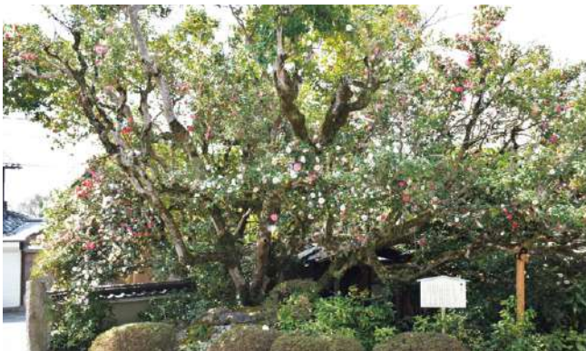
▲散椿見学の際は一声おかけください

五色八重散椿とは、椿の園芸品種で、1本の木に白色を地に紅色の筋が入ったものを基本として、白や紅、ピンクの花が咲き誇ります。その花弁が1枚ずつ離れて散るためその名がついているそうです。歴史上の人物にゆかりがあるなど、遺愛の樹として現代に