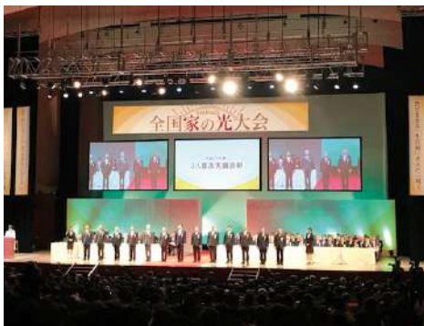
▲盛大に執り行われた全国家の光大会

組合表彰として、当J Aは3年連続の『家の光』高率普及実績表彰を受賞する事ができました。この賞は、普及率30%以上で前年度の月平均部数以上を維持したJ Aを表彰するものです。