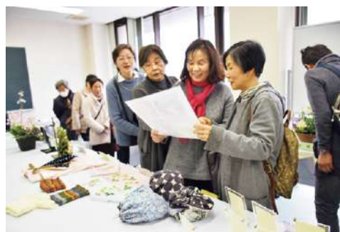
▲レシピを手にとり納得の様子