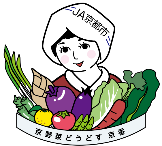
▲JA京都市マスコットキャラクター「京香さん」