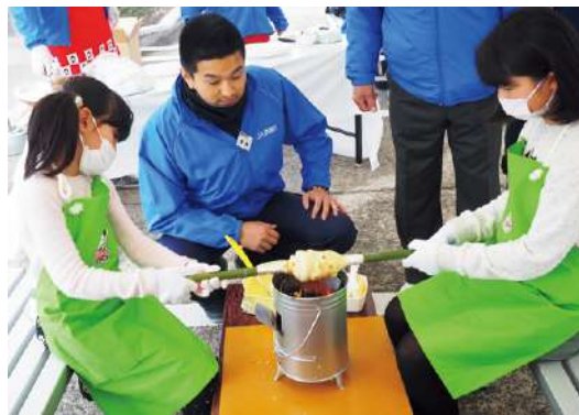
▲バームクーヘン早く食べたいな〜♪

お米の食べくらべでは、3種類のお米で甘さ・香り・輝き・粘りを感じてもらい「どのお米が好き?」「お米によってこんなに違うんやなあ」と親子の会話が聞こえてきました。恒例の紙芝居や野菜クイズ・ビンゴも行われ、笑顔の絶えない1日となりました。 今年度は、2月9日に開催を予定しています。早くも「どんな企画をしようかな?」とフレッシュミズ役員の方々は考えておられます。来年もご参加お待ちしております。