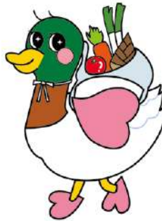
▲大枝支店 大谷萌子 作