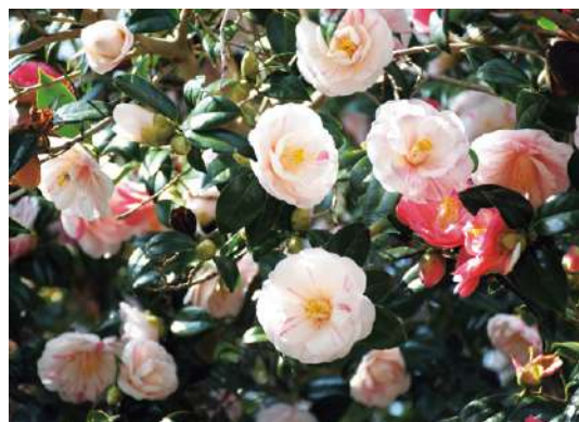
▲一つずつ模様がちがい、ボリュームがある花形