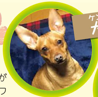
ケンタロウ 犬太郎くん