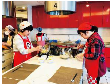
▲手際よく料理を作る参加者

られそう」と好評でした。府内JAのフレッシュミズ会員との交流の中で、有意義な情報交換の場となりました。