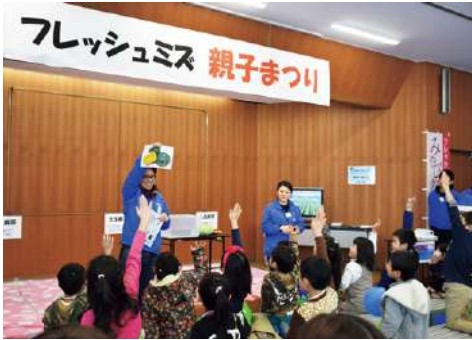
▲大盛り上がりの野菜クイズ・ビンゴ

毎年、食と農をテーマとし、フレッシュミズ役員が1年がかりで企画を考えておられます。今年は「米粉の皮で作るぎょうざ作り」「缶ストープを使った米粉バームクーヘン作り」「お米の食べくらべ」など親子で体験出来るように工夫されました。