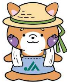
▲総務部 渡部早奈 作