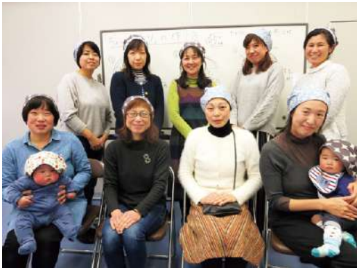
▲ちよいかむりを被ってニッコリ♪