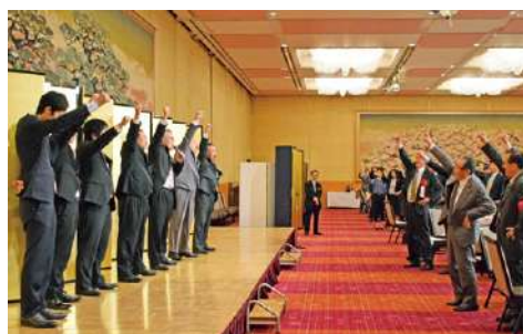
▲頑張ろう三唱で飛躍を誓いました