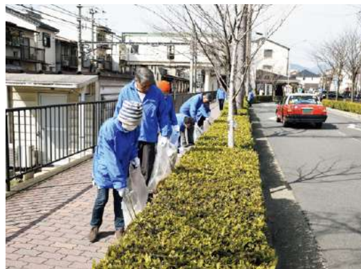
▲協力して地域をきれいになりました

汁とおにぎりが入るまわれ、各 支部同士和気あいあいと交流を 深められた一日となりました。