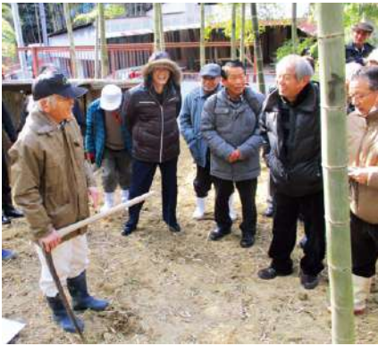
▲活発な意見交換が行われた

ど栽培環境は異なるが、同じ筍生産者同士意見交換を行い、今後の生産技術の向上に努めたい」と話されました。