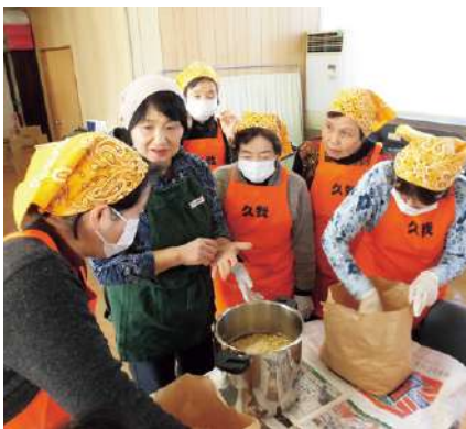
▲味噌作りで交流を深める両女性部員

パーでできあがったお味噌が買 える時代ですが、若い世代へ昔 の人の知恵を継承していきたく い」と話されました。