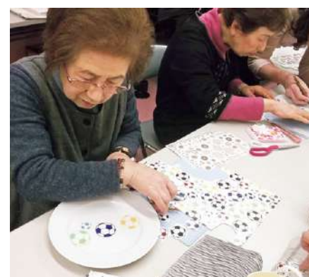
▲世界に一つだけのお皿を作る

2月16日、吉祥院支部女性部 はポーセラーツ教室を開催され ました。ポーセラーツとは、 真っ白な磁器をキャンバスに、 好みの色や柄の転写紙を貼った り、絵の具で着色や絵を描き、 世界に一つしかないオリジナル の陶器作りをすることです。