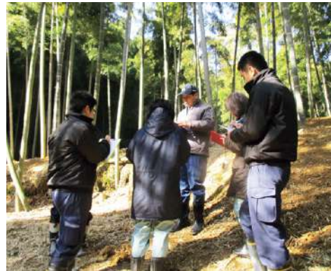
▲手入れの行き届いた筍畑での審査風景