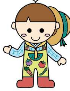
▲大宮支店 徳田史恵 作