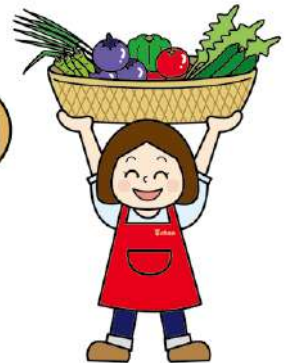
▲参事 清水克彦 作